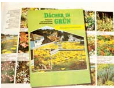
Abb. 2 Eine FBB-Broschüre der ersten Generation