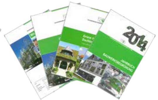
Abb. 4 FBB-Broschüren der heutigen Generation