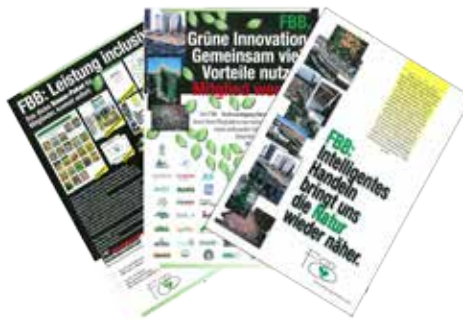
Abb. 3 FBB-Broschüren vor etwa 15 Jahren