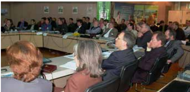
Abb. 5 1. Internationales FBB-Gründachsymposium am 25.03.2003 in Ditzingen