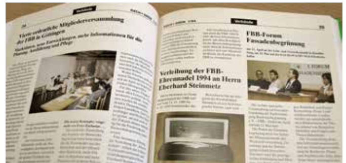
Abb. 6 Eine Doppelseite mit FBB-Aktivitäten, beispielhaft in der "Dach + Grün" Ausgabe 1-1994. Die Fachzeitschrift und die FBB sind seit über 20 Jahren eng miteinander verknüpft