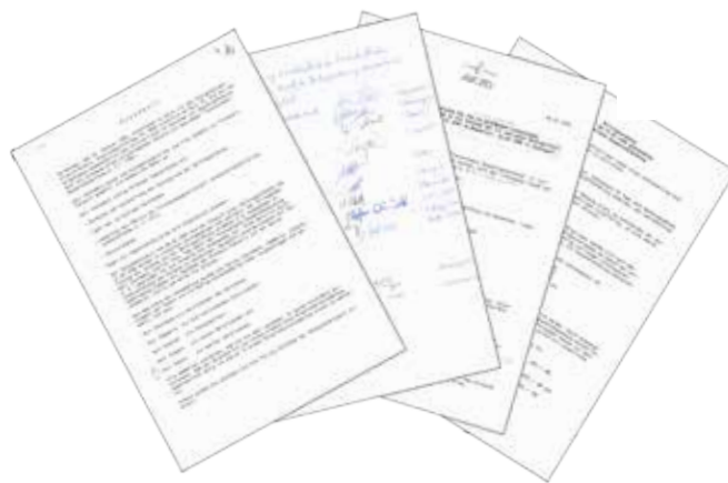
Abb. 1 Historische FBB-Dokumente der Gründung vom 19.02.1990: Protokoll der Gründungssitzung, Unterschriftenliste der Gründungsmitglieder, 1. Satzung und 1. Beitragsordnung